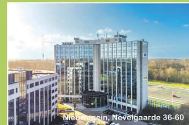
Nieuwegein, Nieuwegeinlaan 36-60