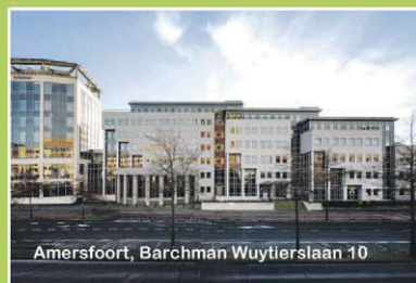
Amersfoort, Barchman Wuytierslaan 10