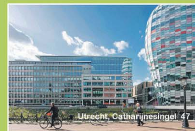
Utrecht, Catharijnesingel 47