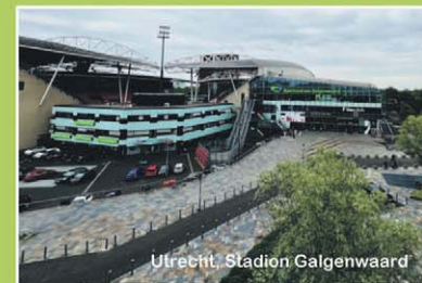
Utrecht, Stadion Galgenwaard