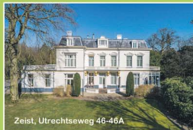
Zeist, Utrechtseweg 46-46A