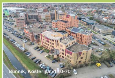
Bunnik, Kosterijland 10-70